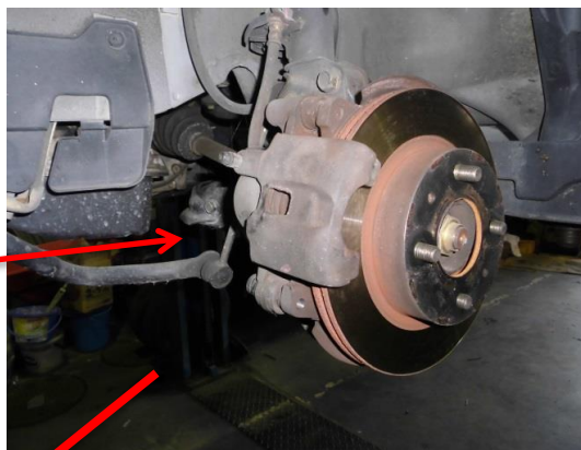
②ブレーキパッドの点検・清掃・グリスアップ