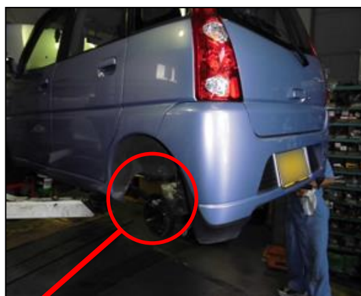
④リヤブレーキ分解・点検・清掃