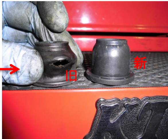
⑧ 亀裂有/損傷 しておりました