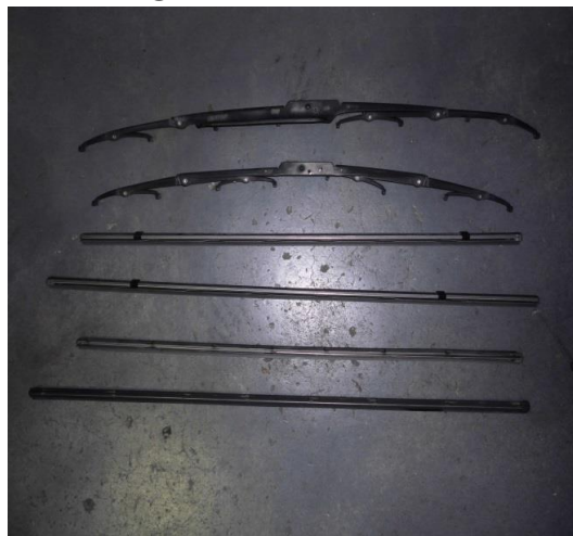
⑥ワイパーゴムの交換