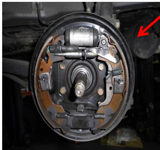
点検・調整・摺動部のグリスアップ