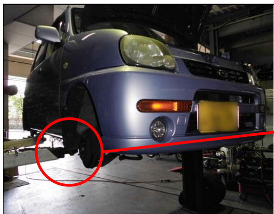
①受入点検→リフトアップ