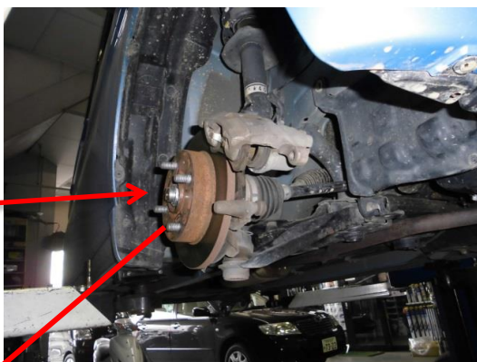
②ブレーキパッドの交換・グリスアップ