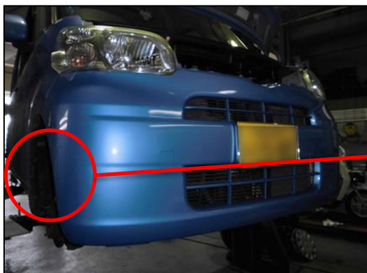
①受入点検→リフトアップ