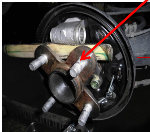
⑤リヤブレーキの分解