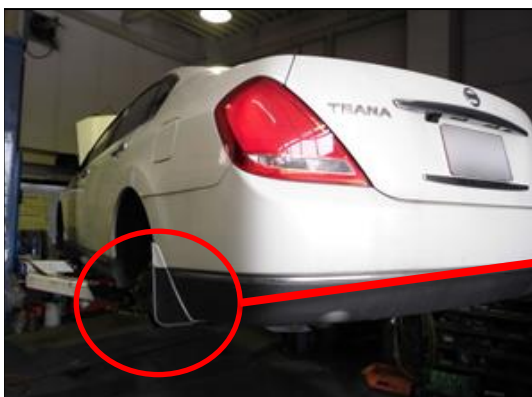
③リヤブレーキ・分解・清掃・調整