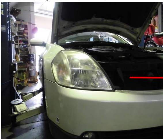
⑦ ヘッドライト変色