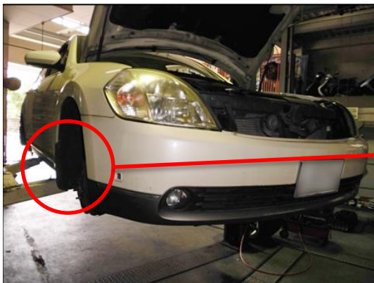
①受入点検→リフトアップ