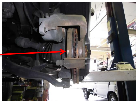
②ブレーキパッドの点検・清掃・グリスアップ